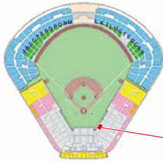
神宮球場座席案内図