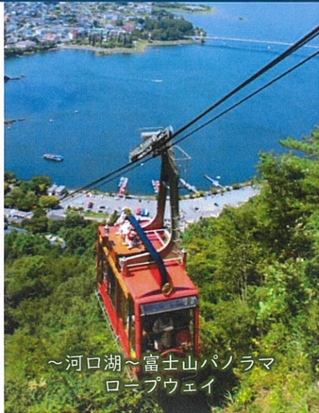
～河口湖～富士山パノラマ ロープウェイ