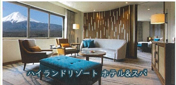
ハイランドリゾート ホテル&スパ